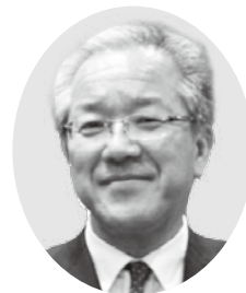
加藤順一(ラグビーフットボール)