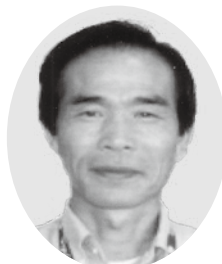
作美悦司 (サッカー)