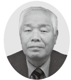
茂木十一(バレーボール)