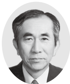
青木正好(ソフトテニス)