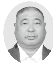
柴本宣広 (ソフトボール)