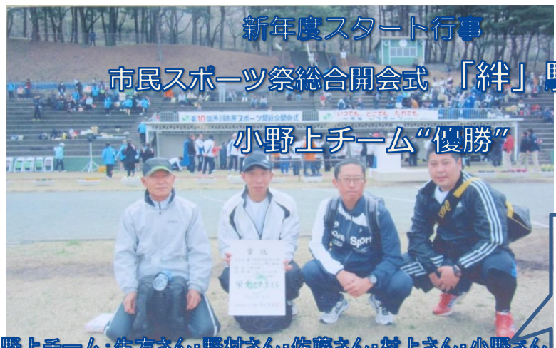
新年度スタート行事 市民スポーツ祭総合開会式「絆」駅伝 小野上チーム“優勝”