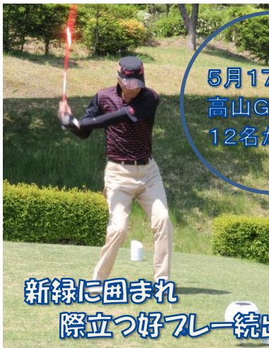
5月17日実施 高山Gクラブ 12名が熱戦